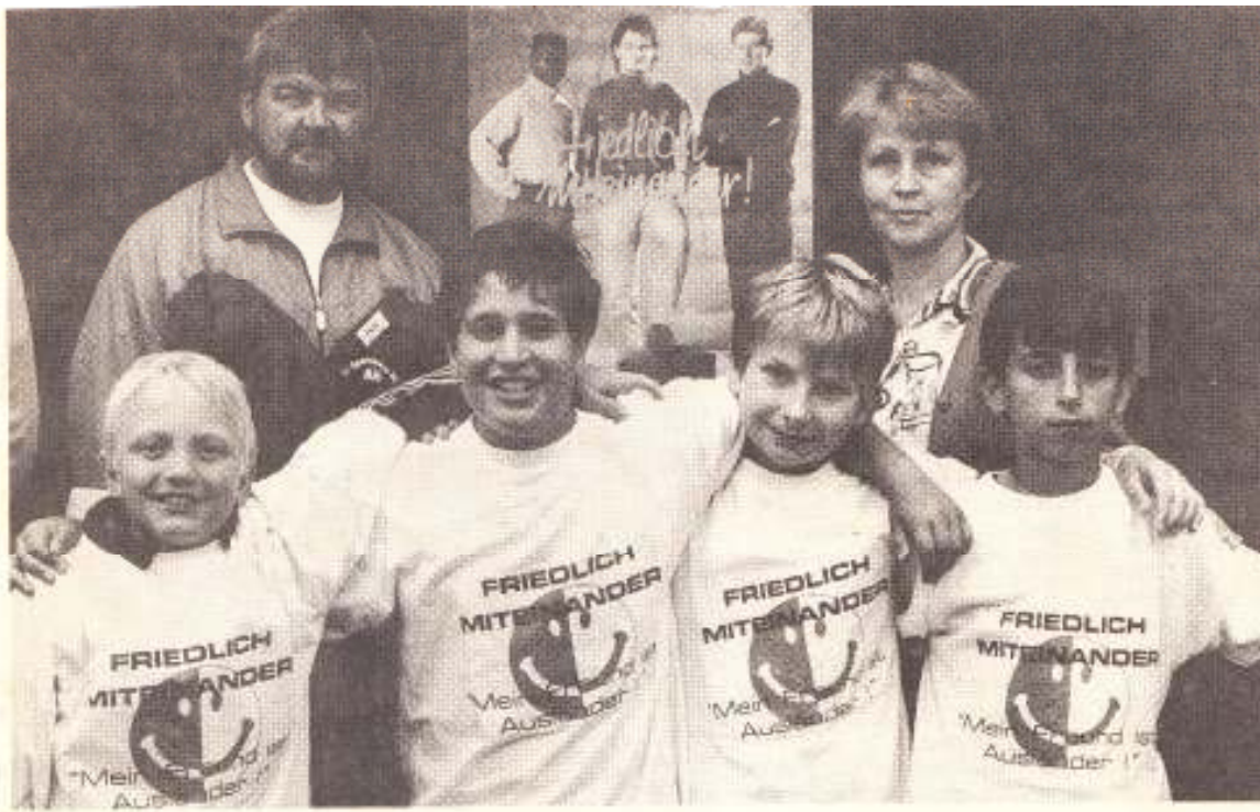
So sollte es sein: Der Fußball- Nachwuchs zeigte in Mar- magen, daß es gar nicht so schwer ist, fried- lich miteinander umzugehen. Die Organisatoren können sich über den Erfolg ihrer Aktion freuen.

Heute: Kölnische Rundschau vom 14. Juni 1993 zum Anlass des Sportfestes 1993.